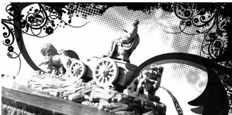
DISEÑO REALIZADO POR UNO DE NUESTROS ALUMNOS

Durante un período mínimo de tres meses , el alumno se incorpora a la actividad laboral profesional en la empresa seleccionada, siendo este período orientativo y ampliable de común acuerdo entre las partes. Pasado el período de prácticas, el alumno podrá beneficiarse, si la empresa lo considera de interés, de su incorporación laboral contractual