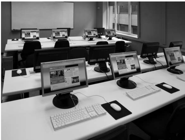
▲ Sala de ordenadores Mac