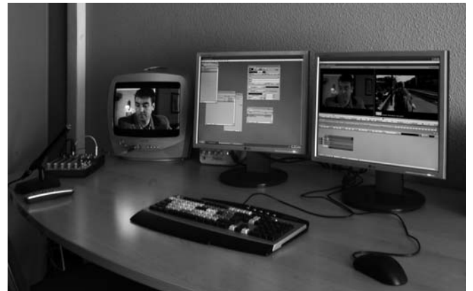
▲ Mesa de montaje avid